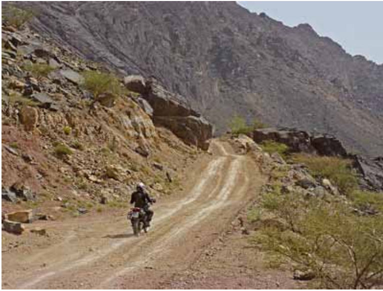
Tribut an die Hitze: Nur mit Protektorenhemd bekleidet fahren wir nach Ras el Khaimah.