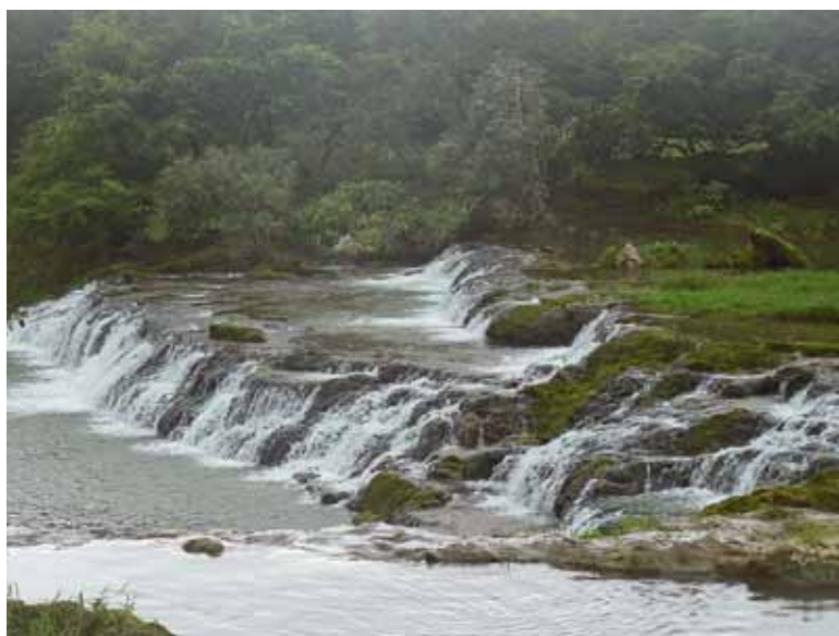
Grüner Oman: Die Wasserfälle von Salalah zeigen das Land jenseits der Wüste.