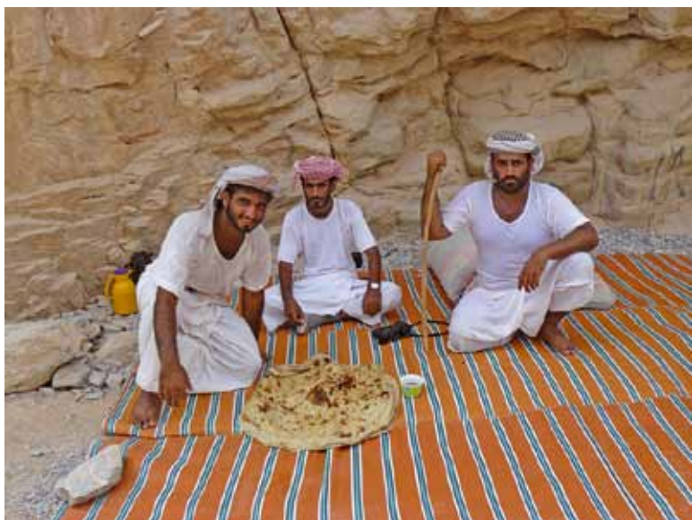
Drei Beduinen beim Frühstück: Fladenbrot, gebacken auf einem ausrangierten Ölfass, mit Wildbienen-Honig.

Am Abend will ich eine Runde drehen, doch das Motorrad springt nicht mehr an – Batterieschaden. So wenne ich Glück im Unglück. Ich bin noch nicht mal richtig traurig und mir fällt auf, dass die Welt für mich unter diesen Umständen früher ganz anders ausgesehen hätte. Unglück ist eben auch relativ und wie sehr man darunter leidet, hängt wohl nicht zuletzt von der jeweiligen eigenen Stimmung ab. Während meiner Reise wird mir diese Erkenntnis allerdings nicht allzuviel nützen und ich werde mich doch über ähnliche Dinge noch ziemlich ärgern. Drei Tage wird es dauern, bis ich eine neue Batterie habe. Für meinen unfreiwilligen Aufenthalt ziehe ich in eines der günstigeren Hotels um. Billige Hotels bergen allerdings auch die Gefahr, dass dort „billige“ Dienstleistungen ebenfalls angeboten werden. So befindet sich in meinem Hotel auch gleich ein Nachtclub. Das Nachtleben in Salalah ist sehr eingeschränkt und bezieht sich auf die wenigen Hotels am Platze. So kommt bei mir allmählich Langeweile auf. Also warum nicht – probieren wir mal das hauseigene