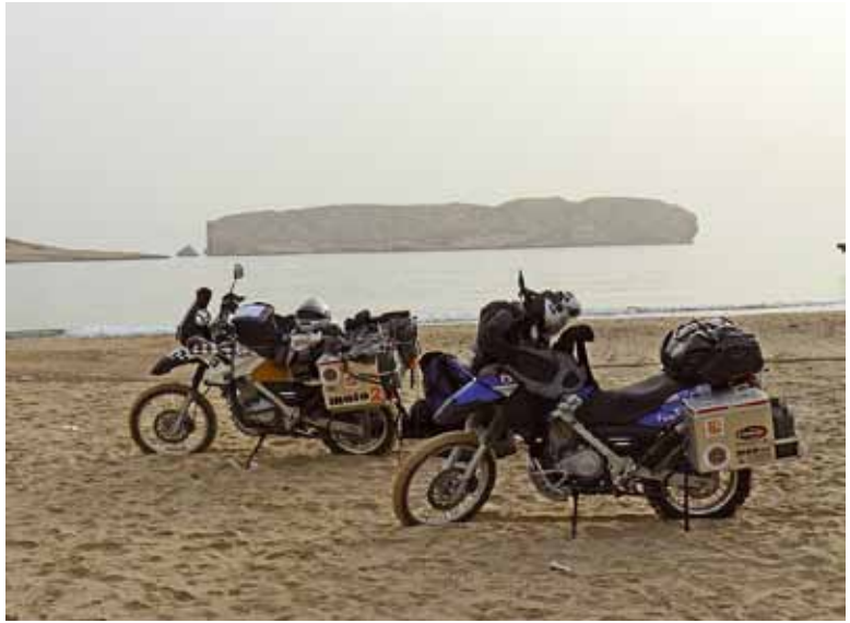
Obacht bei Schlafplatzsuche: Die Straße von Hormuz gilt als Umschlagplatz für Schmuggelware und der Iran ist nur wenige Kilometer entfernt.

die Wüste, dort soll es eine befestigte Straße geben. Die Straße ist tatsächlich da, doch ihr Zustand verschlechtert sich von Kilometer zu Kilometer. Ich bin kräftig am Schwitzen und Fluchen, so hatte ich mir die Fahrt nicht vorgestellt. Es sollte ein gemütlicher Sonntags-nachmittagsausflug werden. Es geht einen steilen Abhang hinunter, ich muss runter bis in den ersten Gang. In einer Kurve steht plötzlich eine ganze Herde Kamele vor meinem Vorderrad und ich muss eine Vollbremsung hinlegen. Das