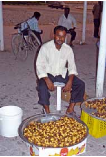
Snack für Biker: Dattel-Verkäufer auf dem Basar von Muscat.

die Wüste, dort soll es eine befestigte Straße geben. Die Straße ist tatsächlich da, doch ihr Zustand verschlechtert sich von Kilometer zu Kilometer. Ich bin kräftig am Schwitzen und Fluchen, so hatte ich mir die Fahrt nicht vorgestellt. Es sollte ein gemütlicher Sonntags-nachmittagsausflug werden. Es geht einen steilen Abhang hinunter, ich muss runter bis in den ersten Gang. In einer Kurve steht plötzlich eine ganze Herde Kamele vor meinem Vorderrad und ich muss eine Vollbremsung hinlegen. Das