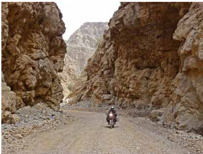
Schluchtige Sachen: Immer wieder windet sich die Piste durch Engstellen.