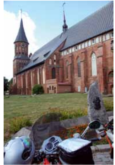
Am Ziel: Das Motorrad parkt vor dem Dom von Königsberg. Hier war Immanuel Kant aktiv.

und nehmen mich in Gewahrsam. Einkaufen bei der Einreise ist strengstens verboten! Sie kontrollieren meinen Pass. Der Grenzer freut sich über mein mongolisches Visa, lacht und lässt mich wieder laufen. Am Zoll wird es schwieriger. Sie legen uns Formulare in kyrillischer Schrift vor. Wir können nur erahnen, wo was eingetragen werden soll. Nach geschaffter Einreise geht es auf der Landstraße weiter Richtung des ehemaligen Königsberg. Schon ein komisches Gefühl, auf einmal die Verkehrsschilder nicht mehr lesen zu können. In Königsberg ist meine Orientierung der Dom, das einzige alte erhaltende Gebäude. Ansonsten macht die Stadt auf mich einen sehr trostlosen Eindruck. Verkommene Betonbauten aus den sechziger Jahren, da will man nicht lang bleiben. Doch wir haben noch eine Mission zu erfüllen. Wir möchten einem Kinderheim T Shirts schenken, die mir freundlicherweise, wie auch das Motorrad, von der Firma Wunderlich überlassen wurden. Doch wie finde ich das Kinderheim „Jablonka“? Im Dom kann ich jemanden fragen, der deutsch spricht und mir den Weg erklärt.