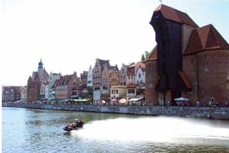
Alte Handelstadt: Danzig überrascht mit vielen alten und ehrwürdigen Gebäuden.

dürfen wir dort leider nicht. Schnell ein Bild und wir müssen die Bayern-Bikes ordnungsgemäß abstellen.