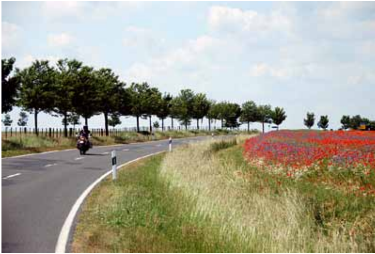
Anfahrtsfreuden: In Mecklenburg erfreuen wir uns an riesigen Klatschmohnfeldern.